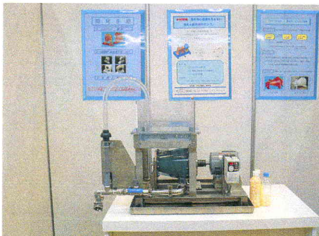
新型ポンプ・実演展示装置