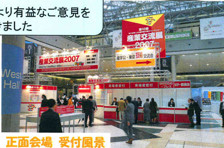
正面会場 受付風景